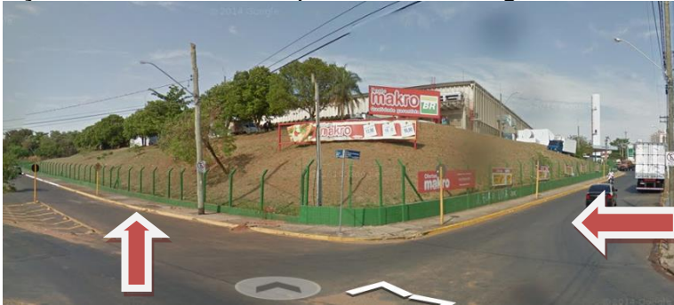
Imagem 1 – Visão geral das calçadas necessitando de plantio de árvores de médio porte

arborização urbana, lei municipal 4368/99, artigo 16.